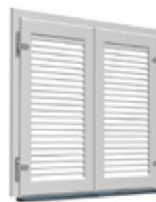
Mallorquina Kiuzo de dos hojas