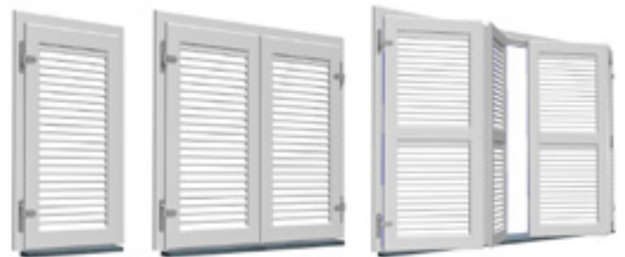
Mallorquina Kiuzo de una hoja