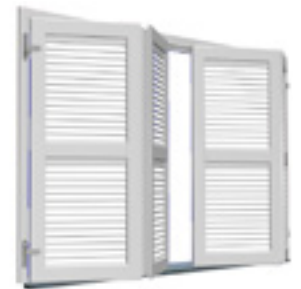
Mallorquina Kiuzo de cuatro hojas plegables